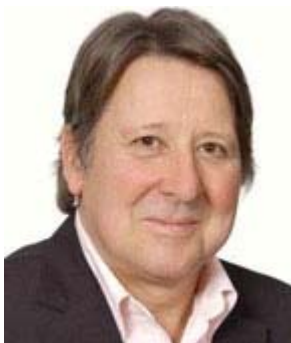
Rüdiger Gohde Bürgervorsteher

Die Stadt begrüßt die Herausgabe des Praktikantenatlases als eine wichtige Arbeitsmarktmaßnahme in Kaltenkirchen und dankt dem Ring für Handel, Handwerk und Industrie für die Ausführung und Umsetzung dieses Konzeptes.